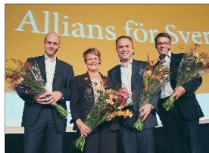
Samma strategi, nytt fokus?

Många väljare uppfattade Fredrik Reinfeldt som det trygga alternativet i valrörelsen 2006, men hade inte riktigt uppfattat att trygghet kräver förändring. Därför blev en del väljare, som bytt från socialdemokratin till moderaterna, snart besvikna på regeringen. Något som syns i opinionsmätningarna, där vänsteroppositionen