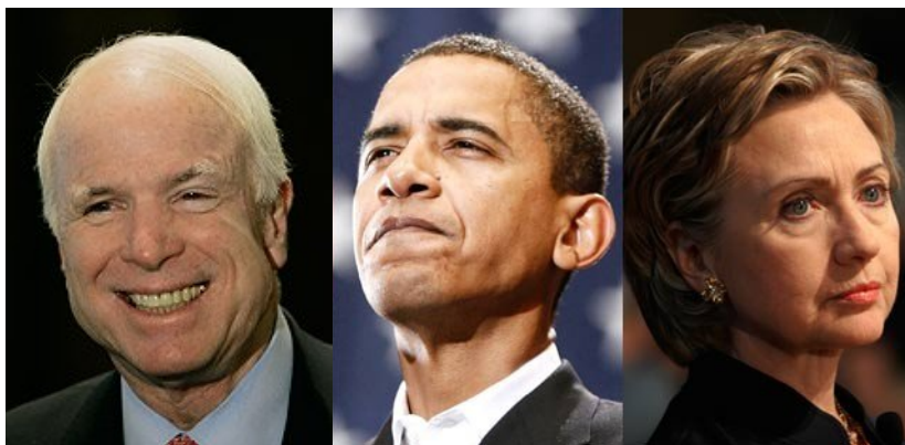
Anledning att le mest just nu har John McCain.

Det är höjden av ironi i det faktum att gruppidentitetspolitiken, ett virus som den amerikanska vänstern spridit globalt,